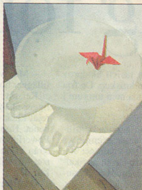
Fötterna på jorden. Tokiko Ishiguros fötter av glas symboliserar individen.